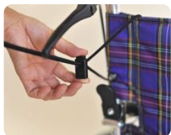
背クッションの取り付け高さは、紐とストッパーでセット

※円背(えんぱい)とは背骨が丸くなる病気のこと、脊柱後彎症のことです。姿勢に気がつけば、なおるものではありません。