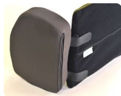
体幹パッドはマジックテープで固定 ※仕様によりファスナー・マジックテープの位置が異なります。

横に傾いてしまうときに脇に入れます。身体をうまく支え、パッドの凹みにお尻がフィットするよう工夫がされています。