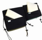
クサビ型クッション 左:標準 右:円背用

出し入れ自由なクサビ型のクッションが入っているのでご自身の腰のカーブに合うよう調整できます。